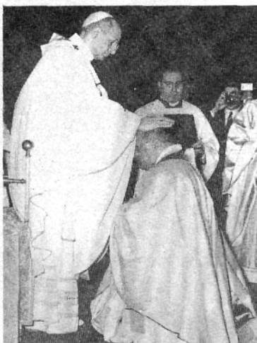
Momento de la Ordenación: Imposición de las Manos del Papa Pablo VI. Roma Italia, Enero 6 de 1969.