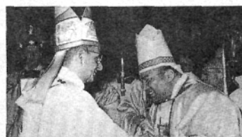
Saludo del nuevo Obispo al sucesor de Pedro: el Papa Paulo VI.