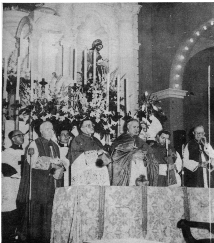
Ceremonia de Consagración de la Catedral de Matamoros el 12 de abril de 1959