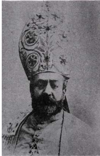
Monseñor Ignacio Montes de Oca y Obregón

El nombramiento no fue bien visto por el gobierno juarista: Montes de Oca había sido capellán de honor del Emperador Maximiliano. Consciente de tal inconveniente, el novel Obispo, procedente de Europa, decidió probar suerte por la frontera norte del país: muy agradable sorpresa se llevó el entonces párroco de Nuestra Señora del Refugio, don Ladislao de J. Ballesteros, cuando vio entrar a su despacho al distinguido viajero con la bula de su alto nombramiento en la mano.