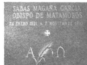
Placa que marca el sitio donde están inhumados los restos del Sr. Obispo Dr. Sabás Magaña García. (Requiescat in Pace)