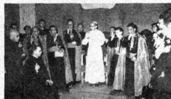
El Papa y los nuevos Obispos dando la bendición.