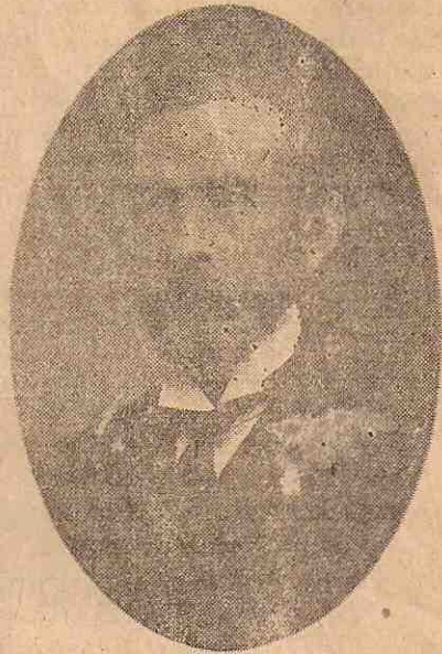
Dr. Francisco de Asis Castro, Literato e Historiador.